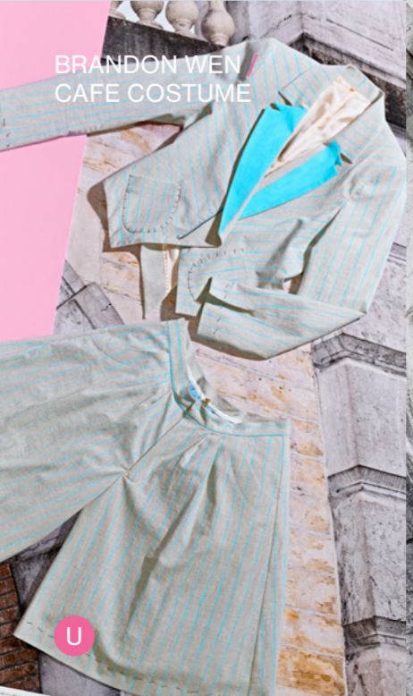
BRANDON WEI / CAFE COSTUME