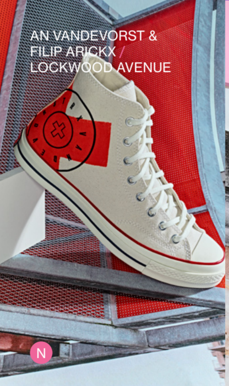
AN VANDEVORST & FILIP ARICKX / LOCKWOOD AVENUE