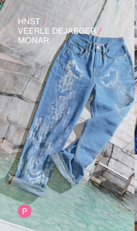
HNST / VEERLE DE JAEGER / MONAR