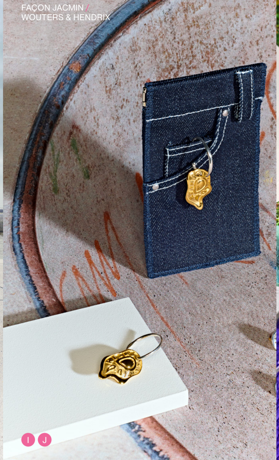
FAÇON JACMIN / WOUTERS & HENDRIX