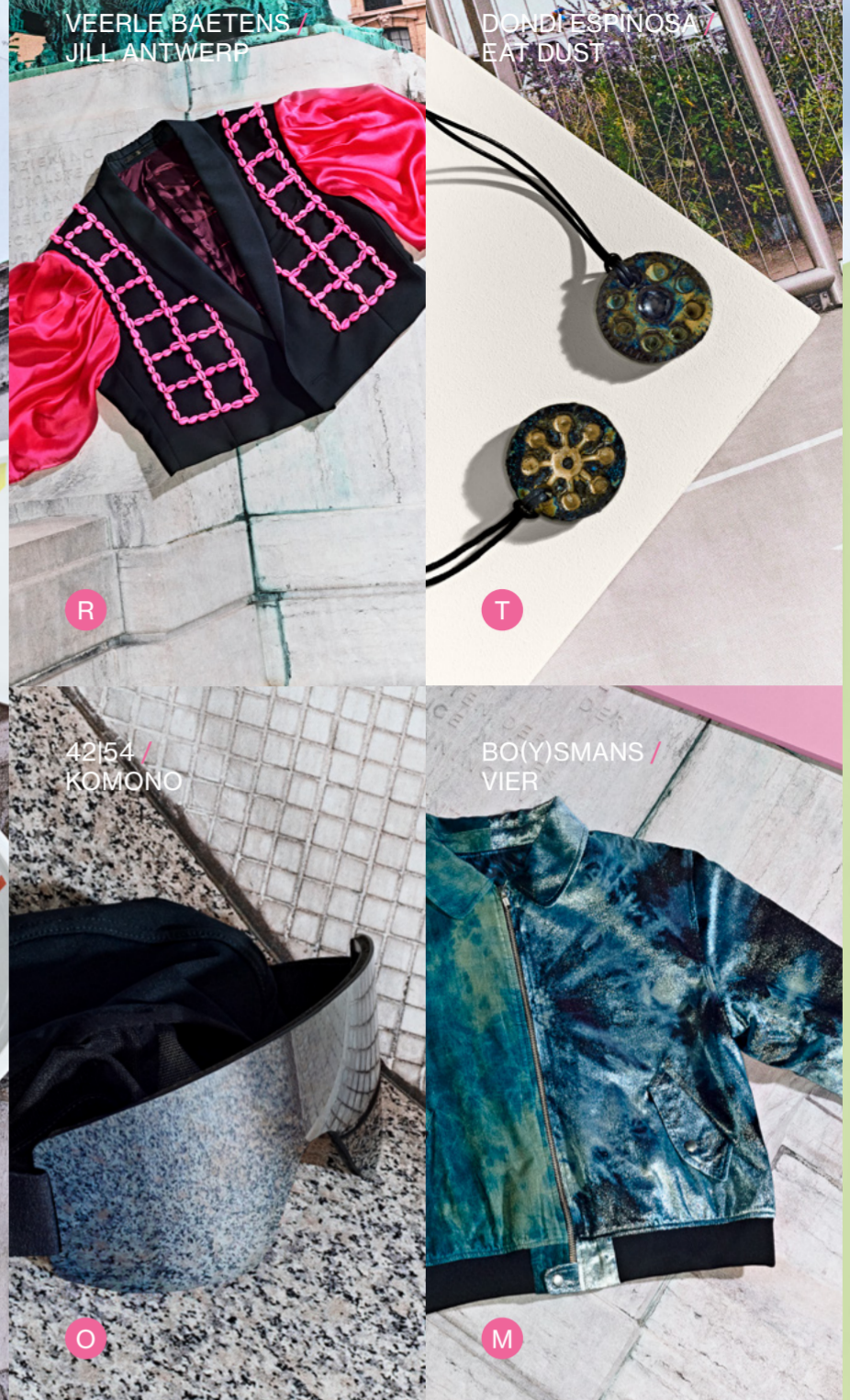
VEERLE BAETENS / JILL ANTWERP