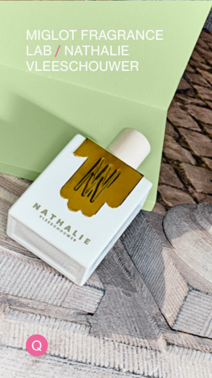
MIGLOT FRAGRANCE LAB / NATHALIE VLEESCHOUWER