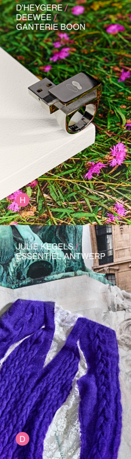
D'HEYGERE / DEEWEE / GANTERIE BOON