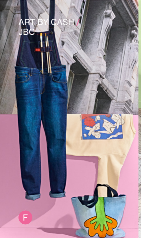
ART BY CASH / JBC