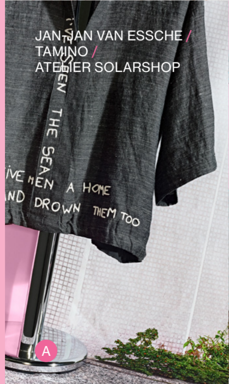
JAN JAN VAN ESSCHE / TAMINO / ATELIER SOLARSHOP