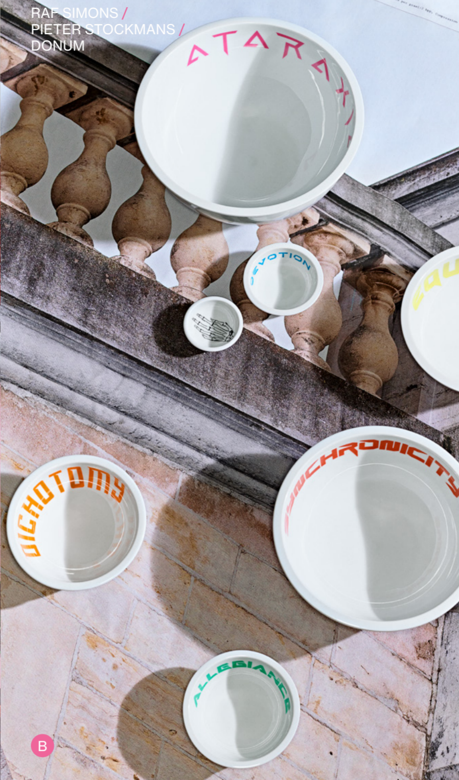
RAF SIMONS / PIETER STOCKMANS / DONUM