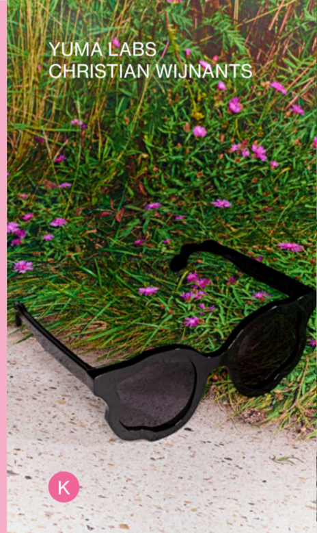
YUMA LABS / CHRISTIAN WIJNANTS