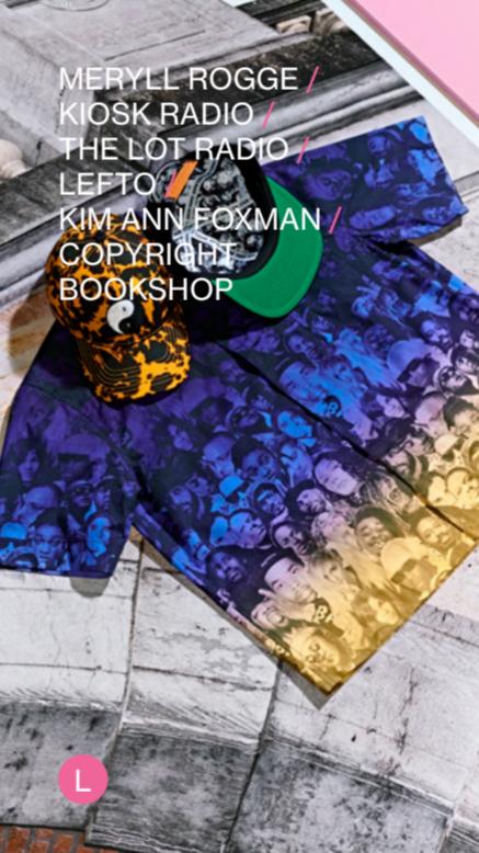
MERYLL ROGGE / KIOSK RADIO / THE LOT RADIO / LEFTO / KIM ANN BOXMAN / COPYRIGHT BOOKSHOP